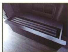
◇ 左センターベッド マット格納家具