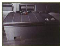
◇ 3rd 横向き座席 & ミニテーブル