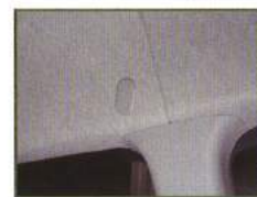
◇ 純正シートベルト ホールキャップ