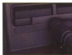
◇ ブラインドカバー