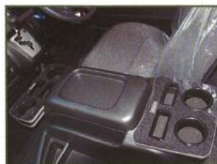
◇ フロントコンソール ミニテーブル