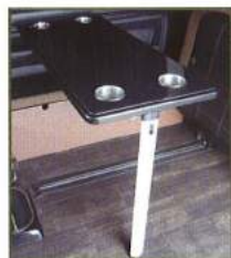
◇ テーブル (カップホルダー×4)