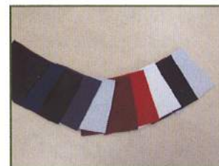
◇ レザーマテリアル