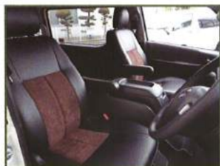
◇ フロントシート張替 & フロントアームレスト