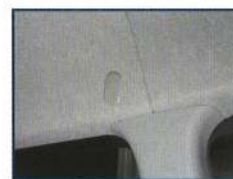
◇ 純正シートベルト ホールキャップ