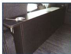
◇ フロントキャビネット (カップホルダー×2)