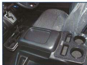
◇ フロントコンソール ミニテーブル