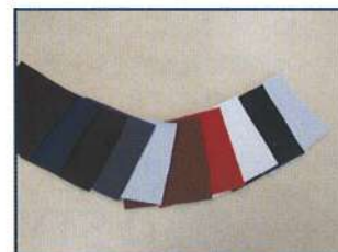
◇ レザーマテリアル