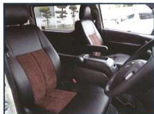
◇ フロントシート張替 & フロントアームレスト