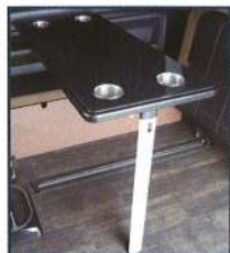
◇ テーブル (カップホルダー×4)