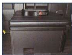
◇ 3rd 横向き座席 (下部マット収納)