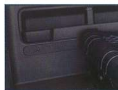
◇ ブラインドカバー