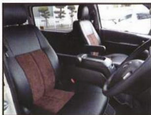
◇ フロントシート張替 & フロントアームレスト