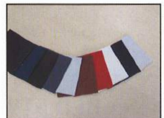
◇ レザーマテリアル