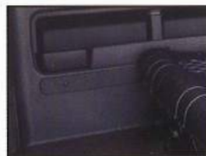
◇ ブラインドカバー