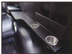
◇ 左サイドテーブル (カップホルダー×2)