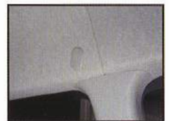
◇ 純正シートベルト ホールキャップ