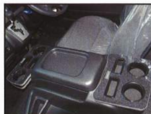
◇ フロントコンソール ミニテーブル