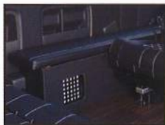
◇ 右家具&サブマット (マット下部収納スペース)