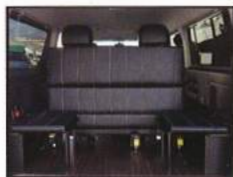
◇ 4thシート 跳ね上げ座席