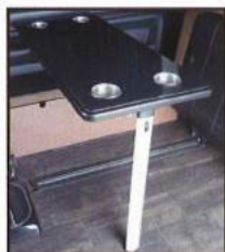
◇ テーブル (カップホルダー×4)